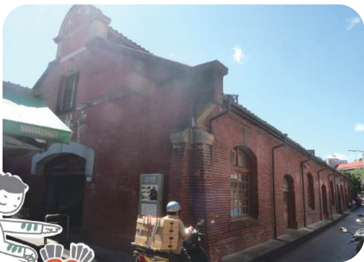
士林公有市場西側外觀