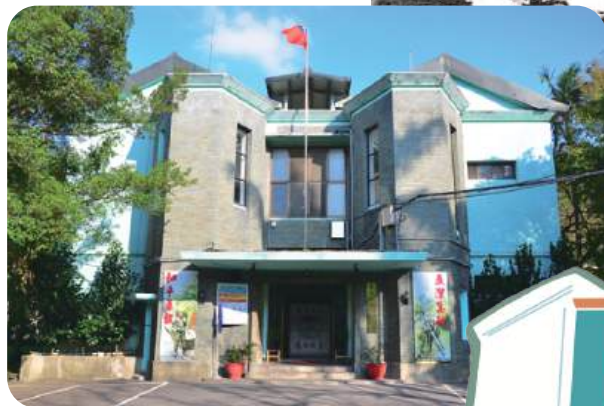
梅莊營區現今外觀