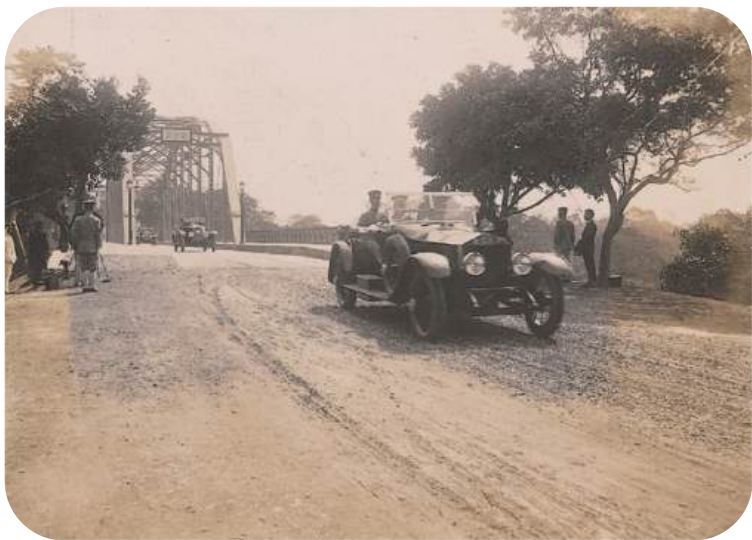
1923年日本皇太子裕仁經明治橋(今圓山橋)赴臺灣神社