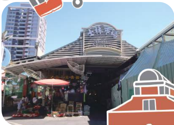
位於基河路的入口招牌