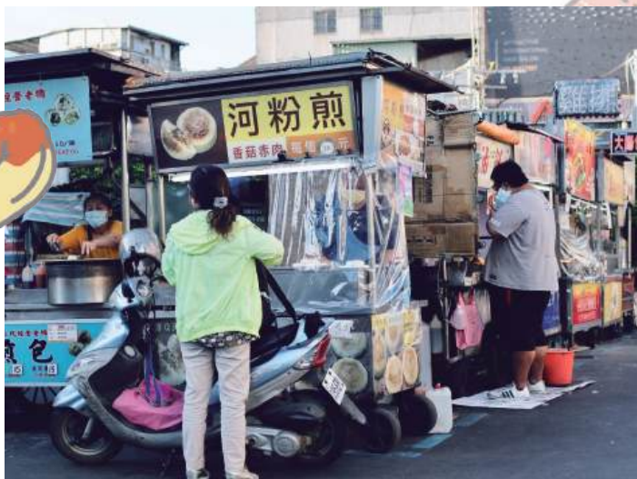
士林夜市攤販景象