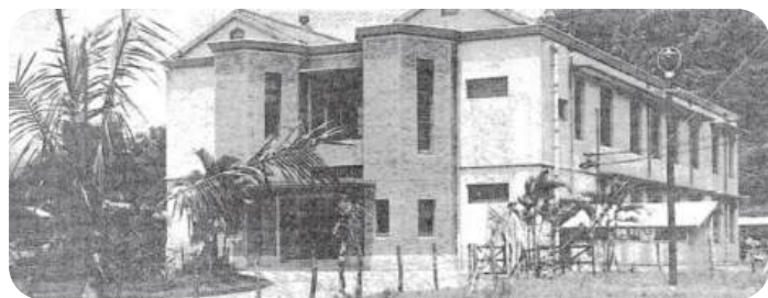
熱帶醫學研究所本館外觀