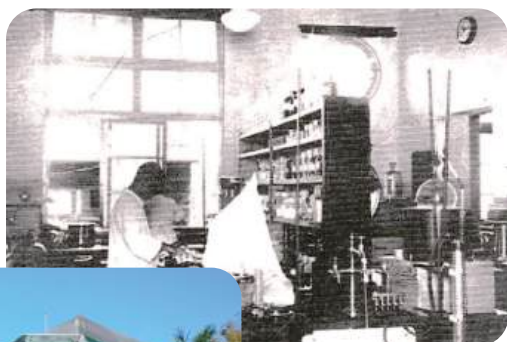
熱帶醫學研究所 內部實驗室