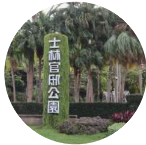
士林官邸公園外觀

士林官邸包括官邸正館、招待所、慈雲亭、凱歌堂四處古蹟本體，以及多處中/西式花園與生態溫室；由於總統曾經居住於此，附近嚴禁改建及新建，使得官邸公園能維持原有的自然景觀，爾後成爲結合自然與人文的休閒好去處。