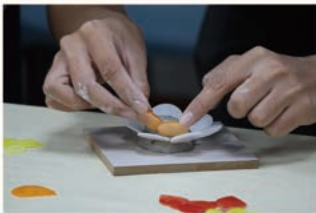
將剪好的玻璃「黏」於水泥上，近似鑲嵌的原理