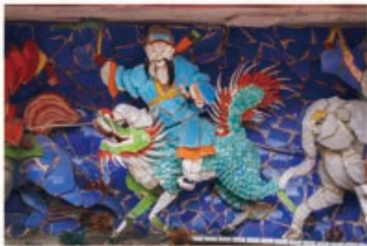
慈誠宮戲樓八仙堵中，使用玻璃製作的呂洞賓

玻璃剪黏，大約在民國40-70年代間，隨著臺灣的工業發展，當時彩色玻璃燈罩大量出口 9 ，也被剪黏的匠師拿來嘗試作為剪黏素材，因材質能透光，在太陽光下非常璀璨耀眼顏色，也會因折射而有不同的美感，一時蔚為流行。由於當時需求量大，許多工廠會生產剪黏專用的玻璃球，使用前司阜再將其敲成片狀。但這樣的彩色玻璃有一致命缺陷，比起碗瓷，玻璃曝露在廟頂及戶外的空間，不耐熱漲冷縮，較難以承受過多的風吹日曬雨淋及溫度變化，壽命約十至十五年左右。