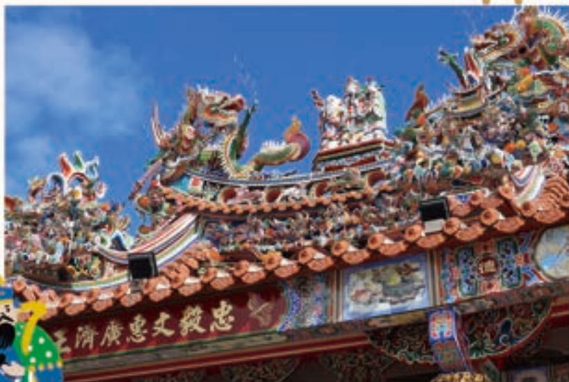
士林惠濟宮三川殿屋脊