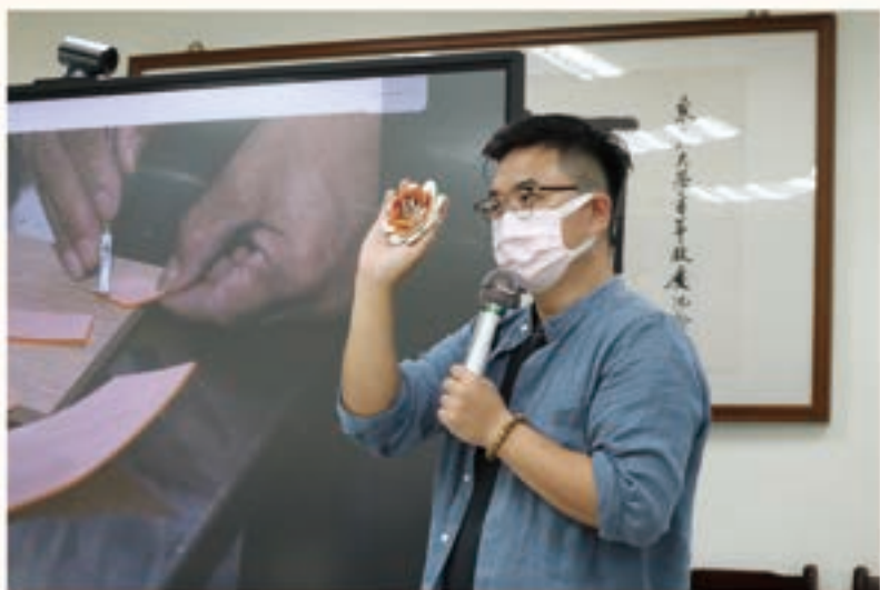
陳威豪司阜來東吳大學進行剪黏技藝的實作教學