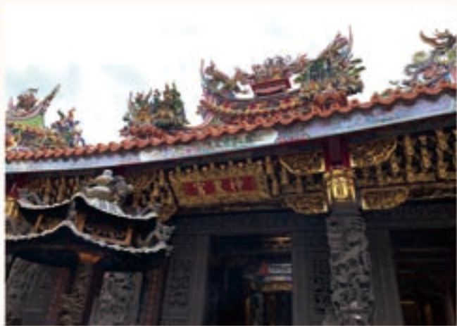
士林神農宮三川殿屋脊