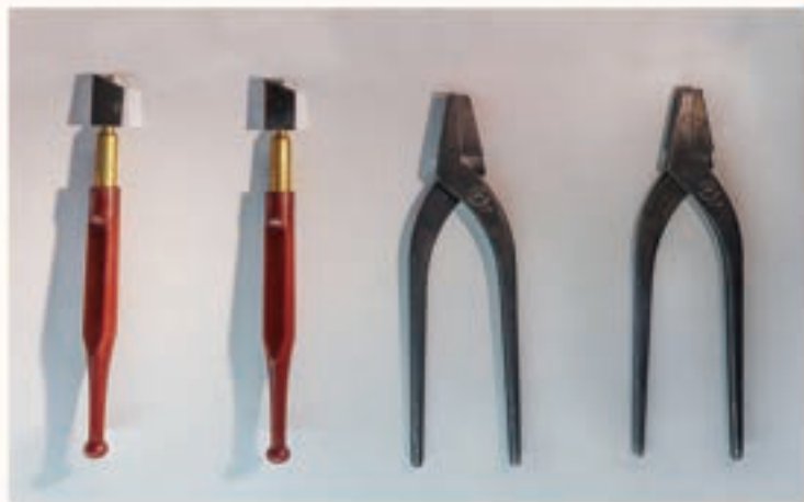
左為鑽筆，右為剪鉗。

剪黏過程中，需要使用碗瓷或玻璃剪成大量且各種不同形狀的素材，有時是龍的鱗片、有時是動物的毛髮，還有許多人物所需要的戰甲或是武器，原材料用鑽筆初步切割後，就會用剪鉗細修成想要的形狀，雖然是剪，實際作法更接近用磨的方式磨出所需的形狀。