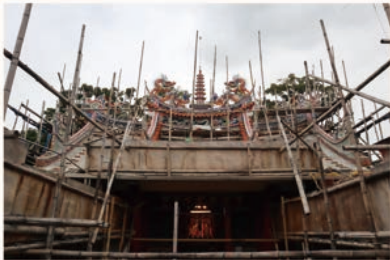
整修中的惠濟宮後殿，惠濟宮後殿一樓祭祀芝山巖觀音佛祖及釋迦摩尼等佛教神明，廟頂上方之剪黏作品為雙龍拜塔。