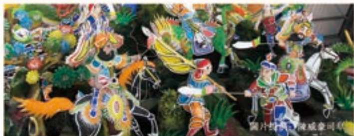
旗津天后宮廟頂玻璃剪黏作品，屬「不見灰」工法。其中武將的戰甲（損撻）與背旗都能更仔細的呈現，邊框部分則是司阜於玻璃上用顏料彩繪。