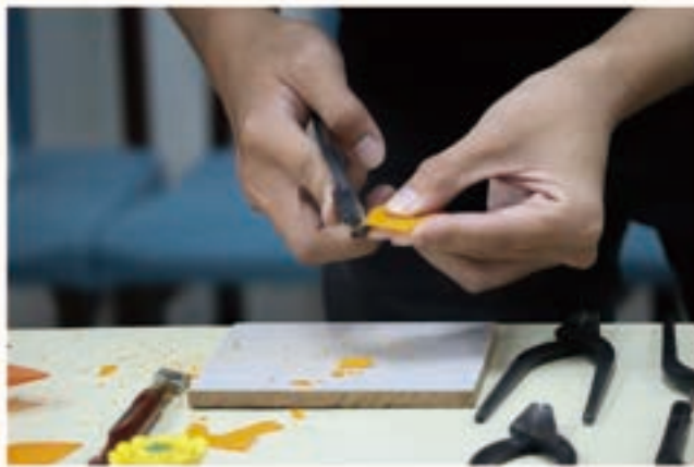
利用剪鉗將玻璃「剪」成想要的形狀

經過逐步堆疊的過程後，於最後一層白灰(水泥)未乾時，將剪好的瓷片一個個鑲嵌在胚體之上，這個步驟會因為材料與鑲嵌方式的不同而產生出各種風格的作品，將於材質介紹及問答的部分進一步解說。「剪黏」雖然就是剪與黏兩個動作，但司阜要經過許多時間，將每一種形狀與每一個部位所需的材料一片一片手工剪出，加上多年累積的經驗，才能完成大大小小不同的作品。