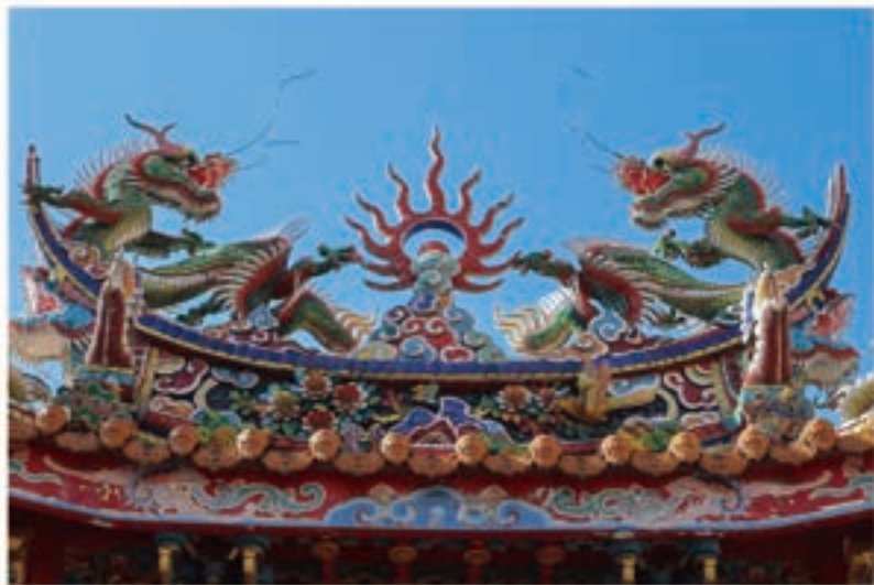
慈誠宮「義路」牌樓上的雙龍搶珠剪黏作品