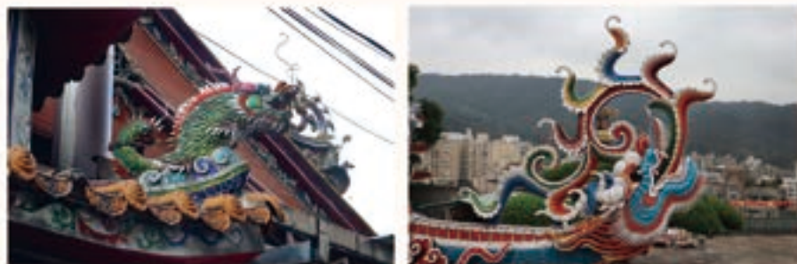
慈誠宮金爐以及惠濟宮廟頂垂帶也可見鯨魚身影

有些人物、動物或物件，之所以會出現在廟中，有其代表的涵義，有時是一種祝福、有時則是保佑建築物本身可以長長久久，讓藝術融合了更多的信仰風俗。廟頂上剪黏作品除龍鳳與人物之外，也常見各式水族，如：魚、蟹、蝦等，由於傳統廟宇多使用木造材質建構，最怕的就是火，也因此有這些象徵「水」元素的生物在廟上希望廟宇能避免祝融之災發生 21 。而常見於廟裡各個角落的鯨魚也有一樣的意涵，「鯨魚」由龍生九子之一的螭吻演變而來，龍頭魚身，傳說其屬水性，也能吞噬火災 22 ，故常見於中國建築的各個角落，期許用火平安。