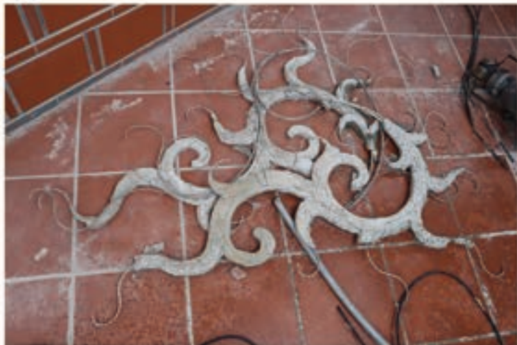
用不銹鋼條作出架構後，再用水泥包覆於不銹鋼條外塑造粗胚