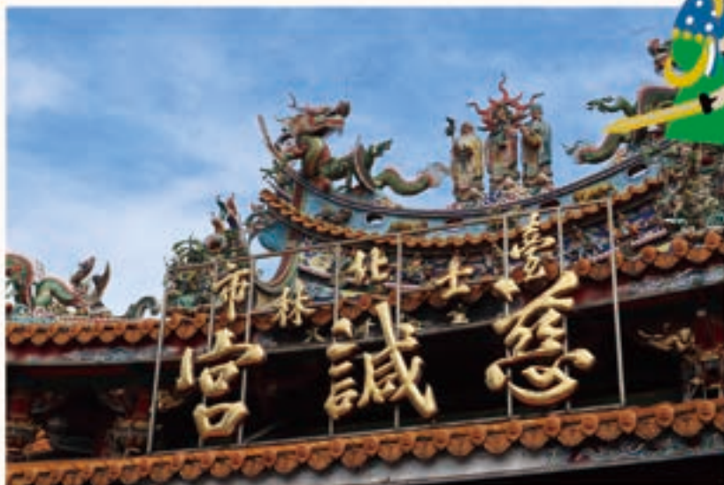
士林慈誠宮三川殿屋脊