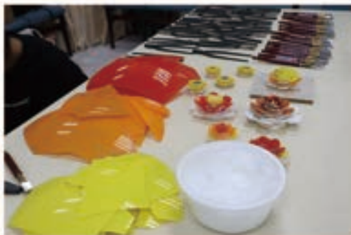
剪黏使用之彩色玻璃，每片皆有原先玻璃球狀之弧度

玻璃剪黏，大約在民國40-70年代間，隨著臺灣的工業發展，當時彩色玻璃燈罩大量出口 9 ，也被剪黏的匠師拿來嘗試作為剪黏素材，因材質能透光，在太陽光下非常璀璨耀眼顏色，也會因折射而有不同的美感，一時蔚為流行。由於當時需求量大，許多工廠會生產剪黏專用的玻璃球，使用前司阜再將其敲成片狀。但這樣的彩色玻璃有一致命缺陷，比起碗瓷，玻璃曝露在廟頂及戶外的空間，不耐熱漲冷縮，較難以承受過多的風吹日曬雨淋及溫度變化，壽命約十至十五年左右。