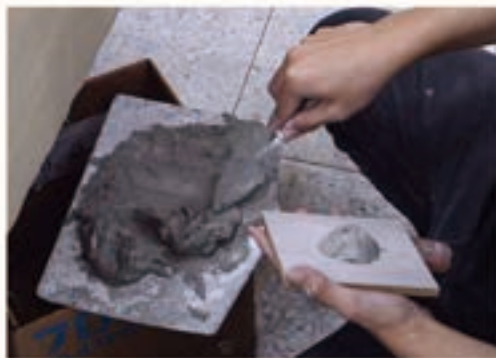
水泥需於土捧上用灰匙仔持續攪拌

為剪黏作品之基底，傳統上使用白灰，現代因成本與便利性多使用水泥。作法是將水泥灰加水融合成水泥漿，並包覆在固定好架勢的不鏽鋼條上，層層堆疊塑造出作品的輪廓，於最後一層水泥未乾之時嵌入瓷片。