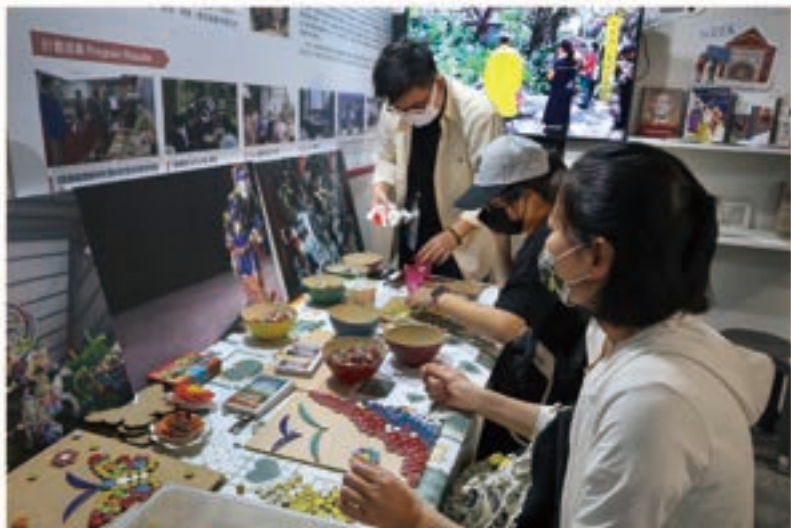
在2022EXPO參與剪黏教學實作的民眾