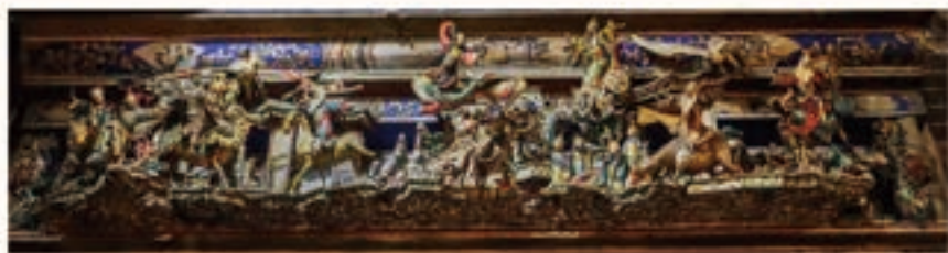
慈誠宮《九曲黃河陣》