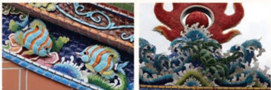
廟頂上的各類水族

有些人物、動物或物件，之所以會出現在廟中，有其代表的涵義，有時是一種祝福、有時則是保佑建築物本身可以長長久久，讓藝術融合了更多的信仰風俗。廟頂上剪黏作品除龍鳳與人物之外，也常見各式水族，如：魚、蟹、蝦等，由於傳統廟宇多使用木造材質建構，最怕的就是火，也因此有這些象徵「水」元素的生物在廟上希望廟宇能避免祝融之災發生 21 。而常見於廟裡各個角落的鯨魚也有一樣的意涵，「鯨魚」由龍生九子之一的螭吻演變而來，龍頭魚身，傳說其屬水性，也能吞噬火災 22 ，故常見於中國建築的各個角落，期許用火平安。