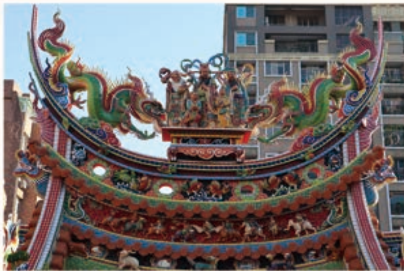
神農宮三川殿廟頂的財子壽三仙交趾陶作品