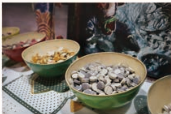
碗內為淋搪工法的馬賽克素材，有不同的大小及形狀。